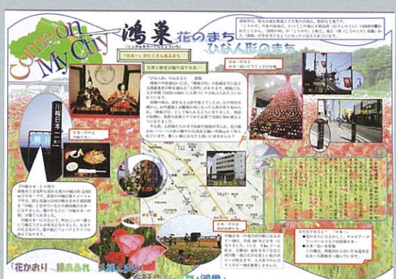
川島 久美子 鴻巣市 すばらしいまち 鴻巣