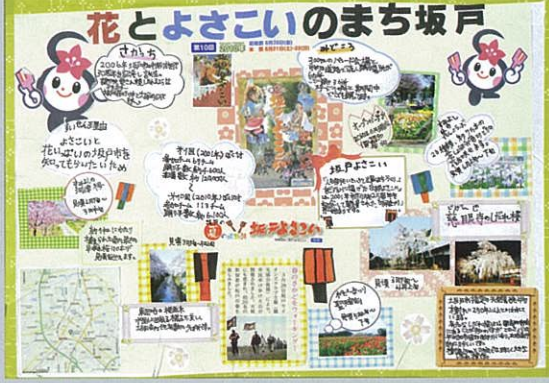
花とよさこいのまち坂戸 田島 陽斗 坂戸市立坂戸小学校