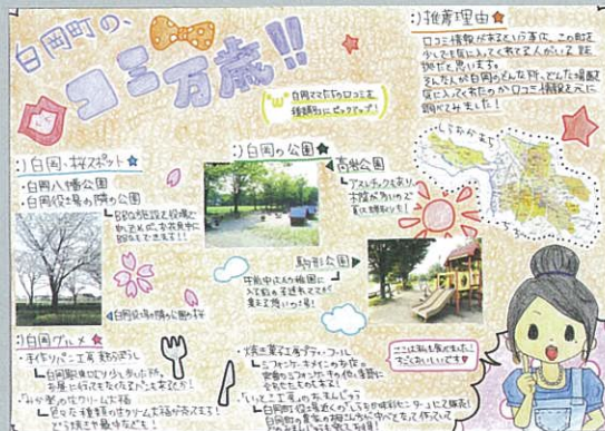
白岡町の口コミ万歳!! 岡安 実乃里 白岡町立白岡中学校