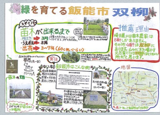
緑を育てる飯能市双柳 香川 安曇 飯能市立双柳小学校