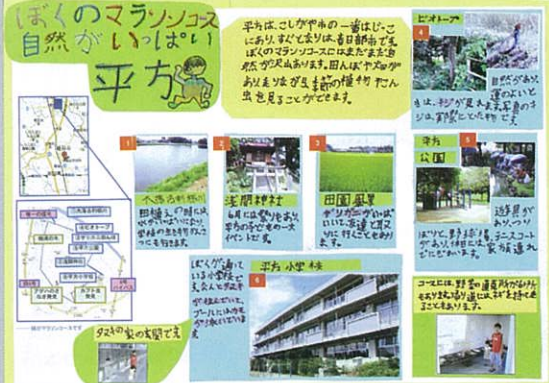
ぼくのマラソコース 自然がいっぱい 平方 常盤 周平 越谷市立平方小学校