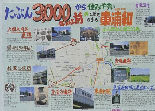
たぶん3000年以上前から 住みやすい緑と歴史のまち東浦和 小野 誠貴 埼玉大学教育学部附属中学校