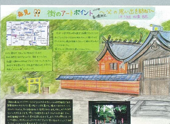
発見!! 街のアーポイント 川口市八幡神社と父の思い出を訪ねて 秋葉 杏花 川口市立上青木中学校