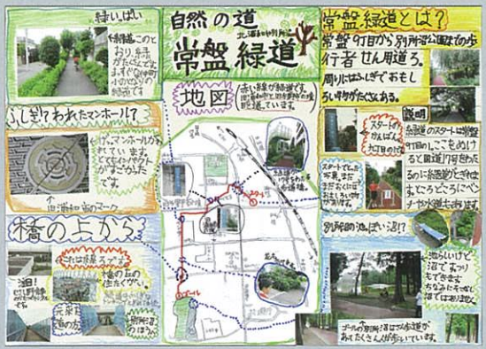
自然の道 常盤緑道 佐々木 大 さいたま市立常盤小学校