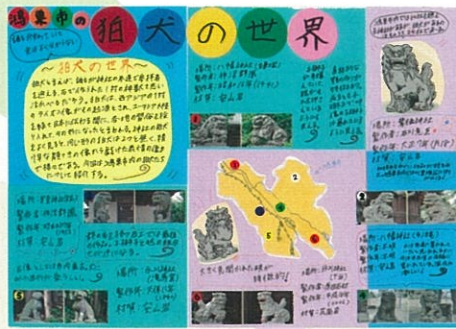
栗原 梨桜 鴻巣市の狒犬の世界