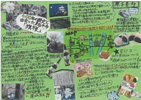
原子 奎多 400年の歴史と 出会った！志木市「旗桜」