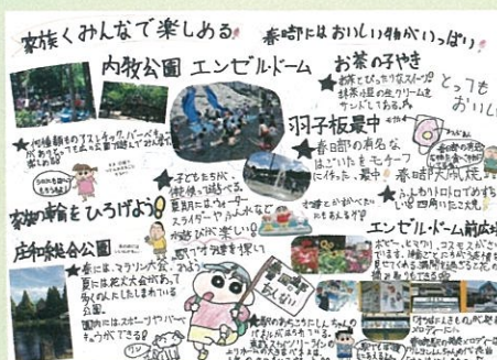
田代 ゆら 家族みんなで楽しめる！春日部にはおいしい物がいっぱい！