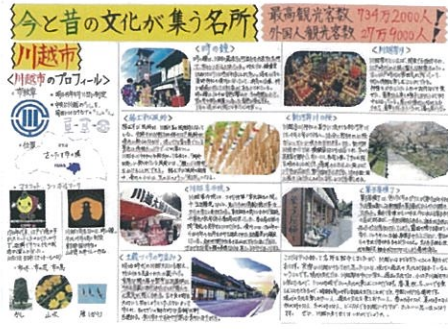
荻 雅貴 誰でも楽しめる町・川越