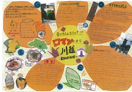
小椋 姫子 昔にタイムスリップ!? ローマのまち川越 KAWAGOE