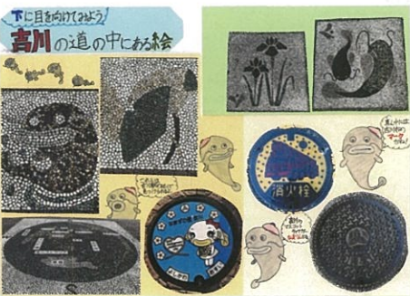
辻 愛花 下に目を向けてみよう 高川の道の中にある絵