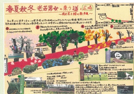
伊良波 里紗 春夏秋冬老若男女の集う道と広場 南区花と緑の散歩道