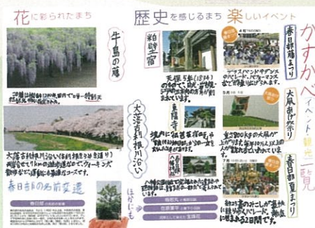
澤田 樹 かすかべ (イベント・観光) 一覧