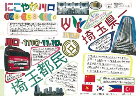
渡辺 仁 にこやか川口