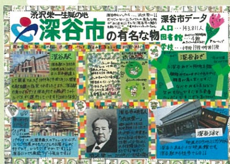
河野 莉奈 沢沢栄一誕生の地 深谷市の有名な物