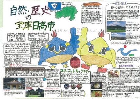
垣中 悠希 自然・歴史の宝庫 日高市