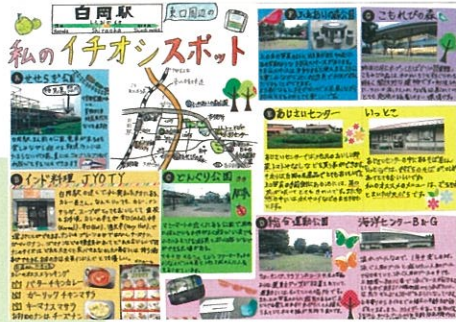
小野田 結衣 白岡駅東口周辺の 私のイチオシスポット