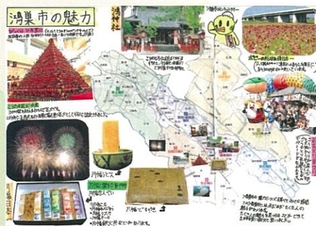
大熊 翼 鴻巣市の魅力