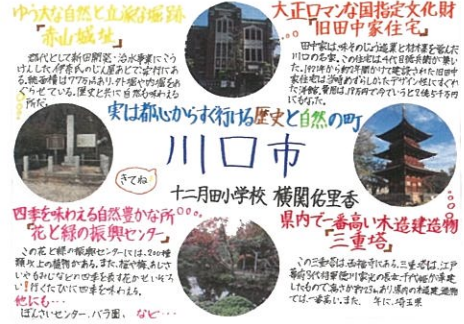
横関 佑里香 実は都心からすぐ行ける歴史と自然の町 川口市