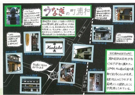
加藤 澁 うなぎの町浦和