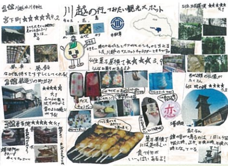
山尾 明音 川越市はよいところがたくさん！