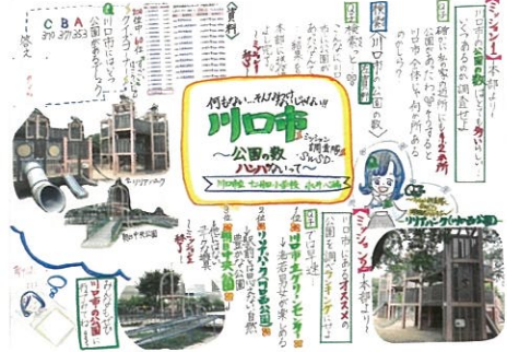
永井 心緒 何もない！そんなわけないじゃない川口市！公園の数ハンパないって！