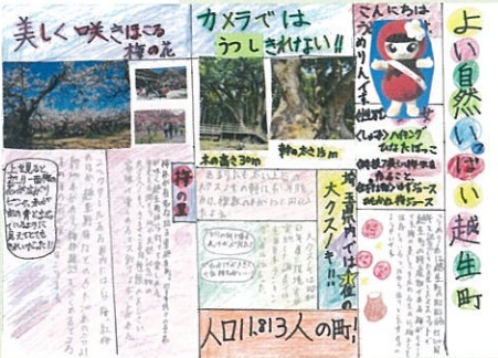
高橋 愛奈 よい自然いっぱい越生町