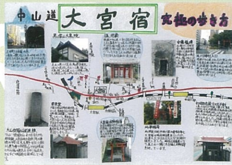
土屋 孝太 中山道 大宮宿 究極の歩き方