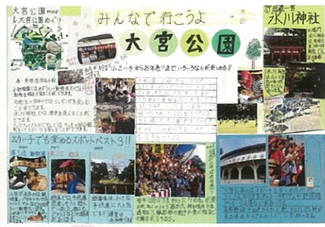
海老原 瑠奈 みんなで行こうよ 大宮公園