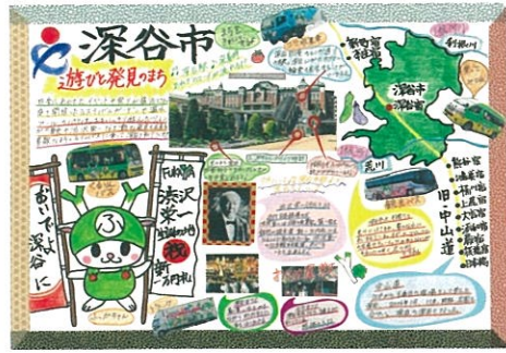
梅澤 碧葉 遊びと発見のまち 深谷