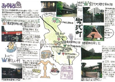
渡辺 諒 宮代町の探検