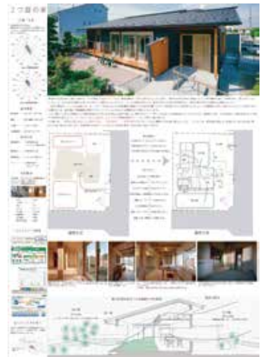
第7回 埼玉県環境住宅賞 埼玉県知事賞