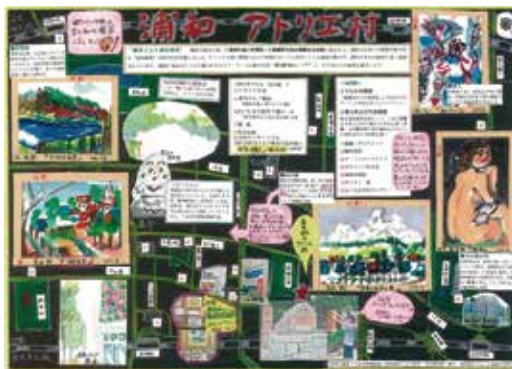
第15回埼玉住み心地の良いまち大賞 埼玉県知事賞