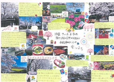
松波 智也 10区さいたま市の 賑わう桜の名所 B級グルメ 伝統行事 イベント楽しいまち