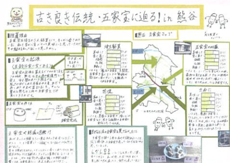
川西 涼太 古き良き伝統・五家宝に迫る! in 熊谷