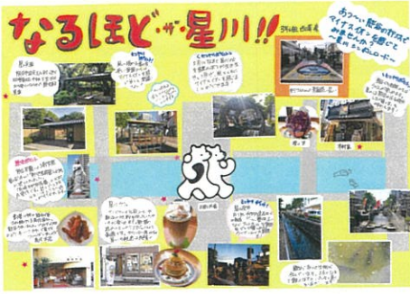
西澤 凜 なるほど・ザ・星川!!