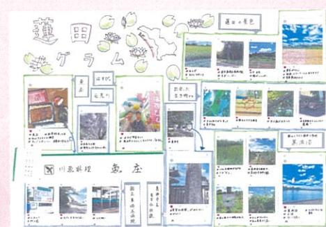
外岡 あやな 自然がいっぱい!!! 「蓮田グラム」