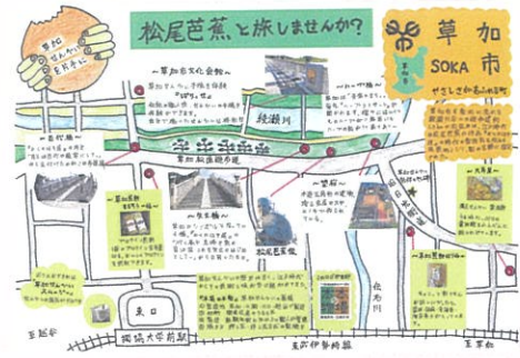
井口 雅仁 草加せんべいを片手に 松尾芭蕉と旅しませんか?