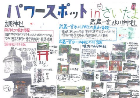
砂川 友里 パワースポット in さいたま