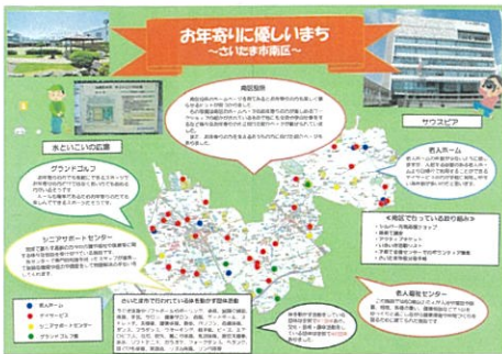
田村 百有愛 お年寄りに優しいまち さいたま市南区