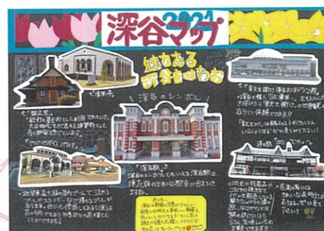
高橋 果恋 魅力の街深谷