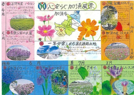
佐原 真英 心安らぐ加須風景