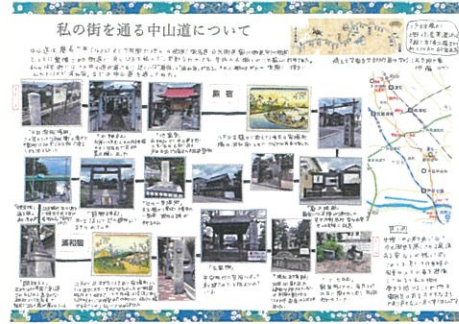
伊藤 ゴウ 私の街を通る 中山道について