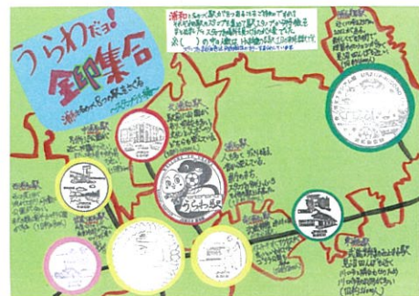
下館 颯介 うらわだヨ 全印集合