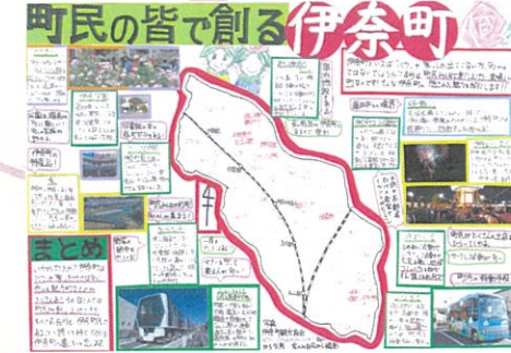
長谷川 美波 町民の皆で創る伊奈町