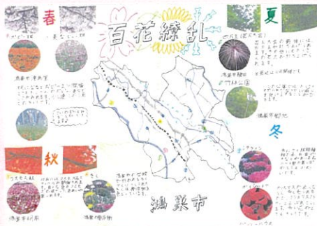
柴崎 美有 百花繚乱 鴻巣市