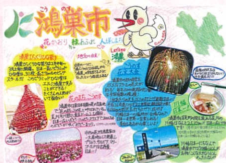
末光 乃愛 鴻巣市 く花かおり 緑あふれ 人輝くまち