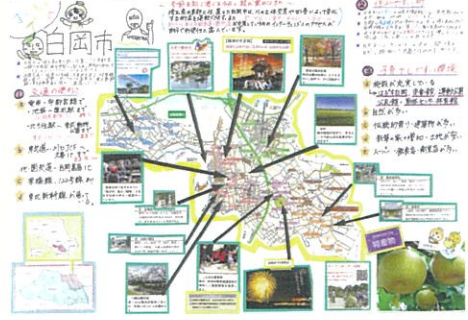
細井 美祐 おいでよー白岡市