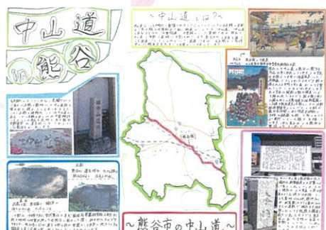
君島 光 中山道 in 熊谷