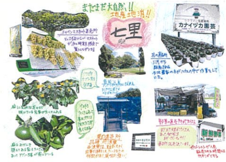
齋藤 澄弥 まだまだ大自然!! 地産地消!! 七里周辺