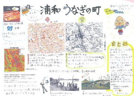
林 桃亜 浦和 うなぎの町