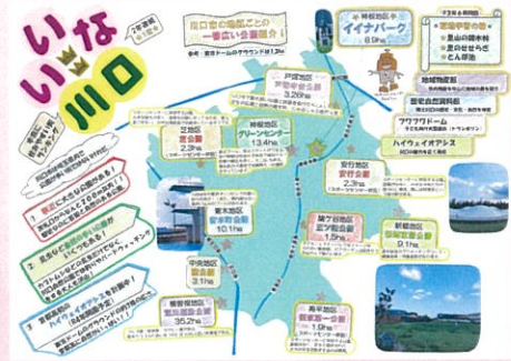
渡辺 詩乃 いないな川口