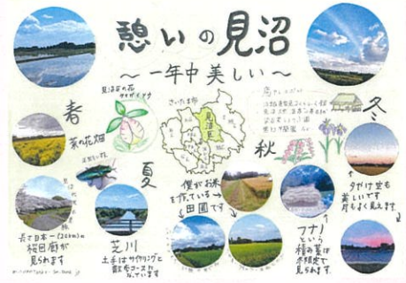
中村 悠右登 憩いの見沼