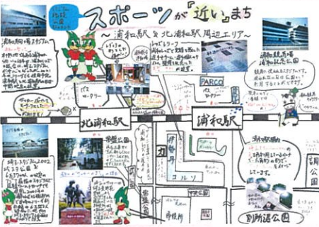
紺野 淳成 スポーツのまち「浦和」