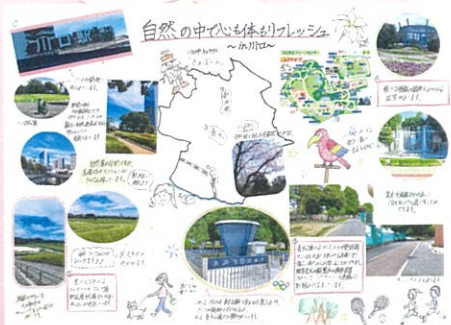
高田 采実 自然の中で心も体も リフレッシュ sin川口市