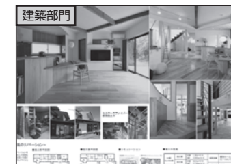
協議会会長特別賞